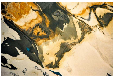
Ancre 50 x 70 cm