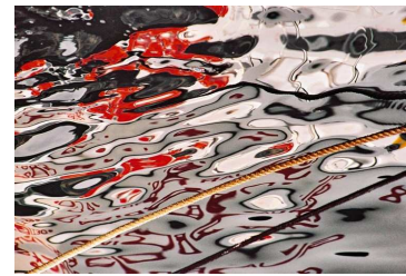
Bout 50 x 70 cm