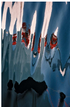
Lueurs 60 x 90cm