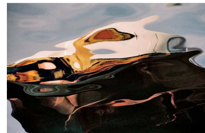
Masque 50 x 70cm