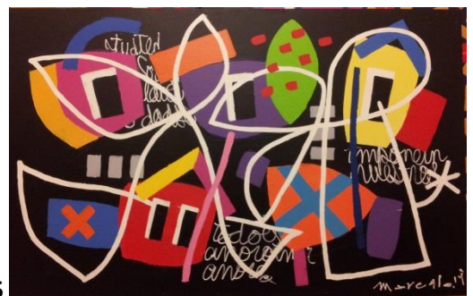
Chemin blanc, 75 x 115