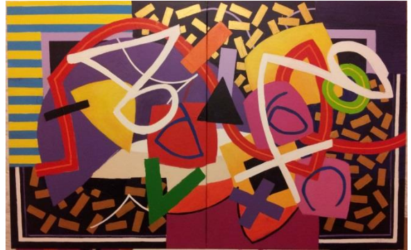
Décomposition, 100 x 160