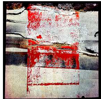
Trace urbaine Peinture N°4