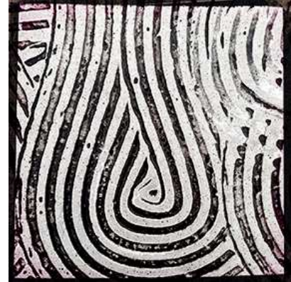
Trace urbaine Bande N°1

Tirage jet d'encre sur papier Epson, montage Dibond Limité en 5 exemplaires Format 50 x 50, 100 x 100 et 170 x 170