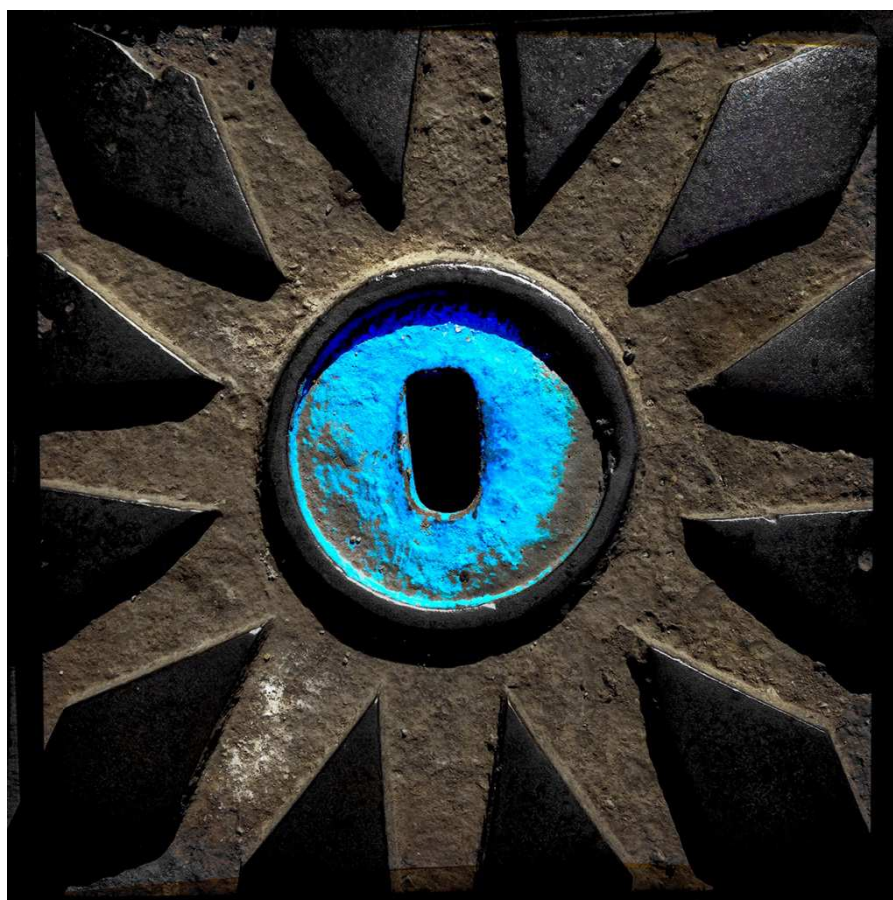
Trace urbaine Plaque N°63