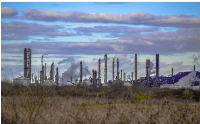
Domes & arrows