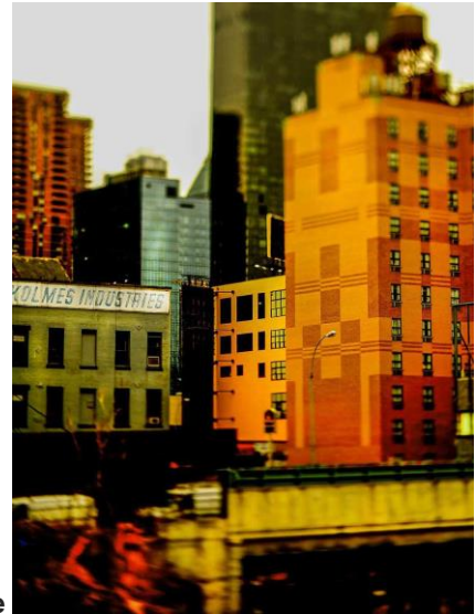
Upper east side

Tirage Pearl support alu dibond Edition limitée : 1/15 pour New York et 1/5 pour les photos Indus